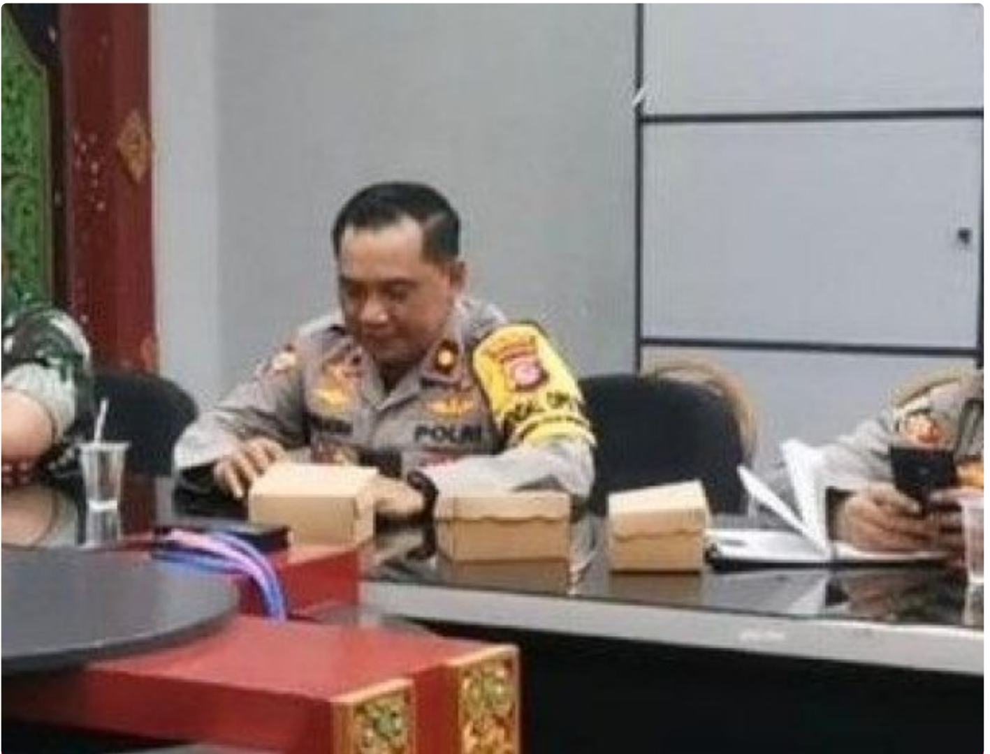
Kabagops Polresta Mataram saat menghadiri Rakor di Kantor Bupati Lombok Barat, Selasa (10/12/2024)